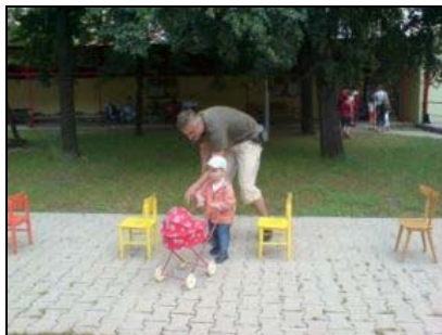
S tátou na hřišti