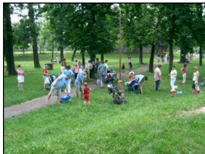
Hravé odpoledne pro celou rodinu