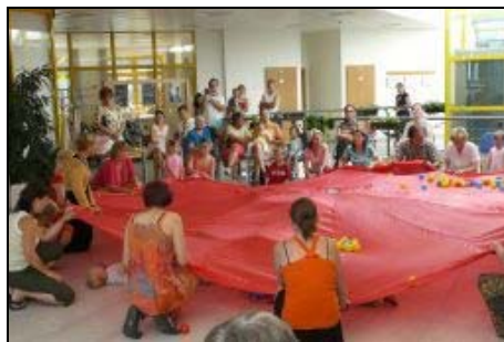
Vernisáž výstavy