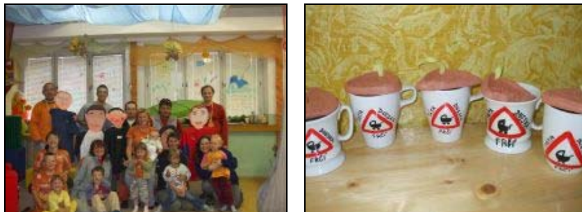
Hromadná fotka a dárky pro tatínky

15.června připravili v MC MaMiNa rodinné odpoledne se soutěžími a překvapením. Nechyběly dárky od dětí a maminek pro tatínky – hrneček s vlastnoručně nakresleným logem kampaně, medaile – 1. tatínek. Dále maminky vyrobily „kopii“ hlavy svého partnera z kartonu, oblékly do oblíbeného trička a vystavily v MC. Byla připravena také nástěnka s fotografiemi na téma: Táta včera a táta dnes se mnou. Druhou část kampaně pak tvořil výlet na Ostaš – rodinný výšlap s opékáním buřtíků. Akce se vydařila i přes relativně malou účast.