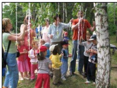
Putování s princeznami