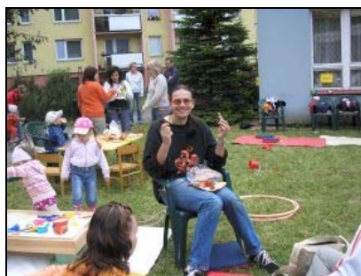
Setkání před prázdninami