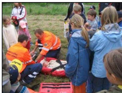
Výprava do Měsíčního údolí a záchranná akce