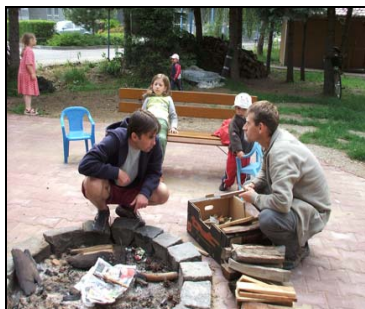
Společné opékání