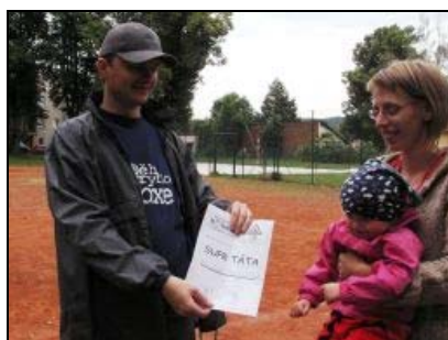
Sportovní odpoledne na hřišti