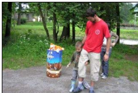
Den dětí a Den otců na ostrově Santos