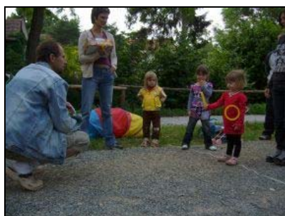
Zábavné sobotní odpoledne