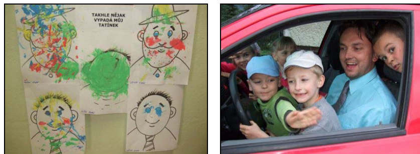
Tatínkové na obrázku, společné odpoledne

Malé děti v Centru Mateřídouška nejprve malovaly obrázek pro tatínka – některé maminky svým děťátkům pomáhaly, jiné se nestačily divit, jaký talent jim doma roste. Děti malovaly tatínky a vesele se povídalo o tom, co který umí a v čem je „nejlepší“. 12. 6. 2008 se pak v odpoledních hodinách rozpoutalo sportovní klání. Hrál se volejbal, nohejbal, děti nezapomněly ani na přehazovanou a hru na schovávanou. Tatínkové se předvedli, jak hravě zvládnou hrát nohejbal, utírat nosík své ratolesti a přitom mamince pózovat do fotoaparátu, nebo samozřejmě zajistit pro rodinu i občerstvení v podobě pěkně vypečeného vuřtu. Děti jim za to namalovaly obrázky, kde ústředním motivem byl tatínek, tak jak ho vidí – většinou v autě či na cestě do práce.