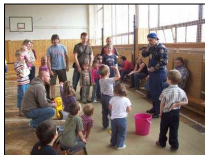
Zábavné odpoledne