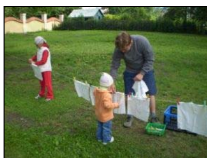
Společná akce pro rodiče a děti