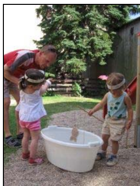
Indiánské odpoledne