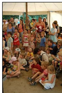
Dětský den ve Stromovce