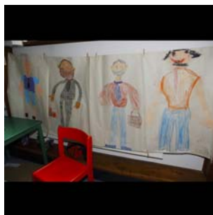
Vernisáž výstavy v Městské knihovně hl.m.Prahy