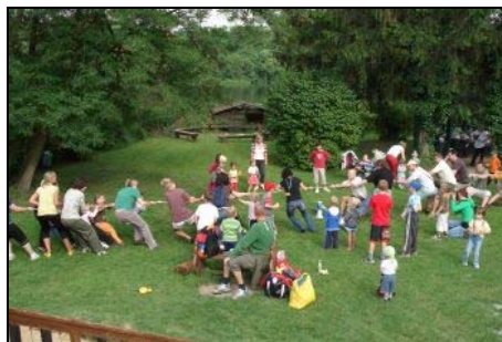
Bubnování a zahradní slavnost