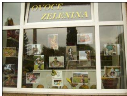
Fotovýstava „Jak mám tátu nejraději“