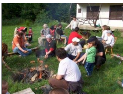
Pirátská cesta