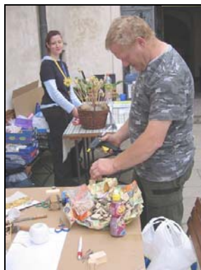
Výroba hraček ze dřeva