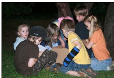
Bojovka na Kampě „S tátou v jednom ohni“