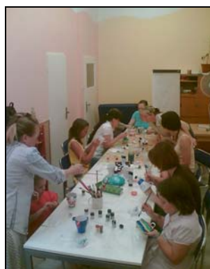
1.místo ve fotosoutěži a výtvarná dílna (foto KMC Barrandov Praha 5)