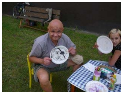
Soutěže a malování obličejů na tácky