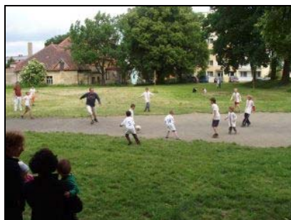
Fotbalový zápas

V Březnici se v rámci kampaně konal fotbalový zápas tatínků proti dětem, kuličkáda a soutěž o nejlepší „štrůdl“. Od podzimu 2007 probíhá navíc v MC Pampeliška kampaň „Aby bylo v Březnici milo...“, jejímž cílem je zlepšit spolupráci MC, městské samosprávy a veřejnosti. Tato snaha byla tímto odpolednem zcela naplněna. Členům i nečlenům MC byly nabídnuty dvě hodiny plné zábavy a radosti dětí i rodičů. Akce byla navíc podpořena místními podnikateli a účastí členky městského zastupitelstva.