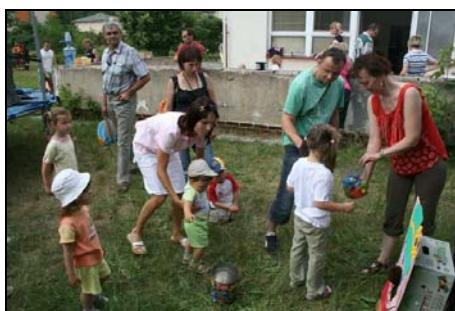
Sportovní odpoledne