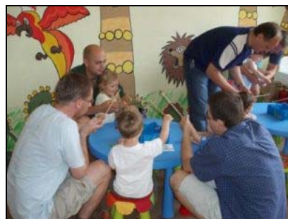
Společné dopoledne pro tatínky s dětmi