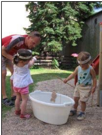
Indiánské odpoledne

Loňský úspěšný ročník kampaně měl letos neméně úspěšné pokračování. Třetí červnová neděle, která se v některých zemích slaví jako Den otců, vyšla tentokrát na 15. června a tak kampaň probíhala po čtrnáct předcházejících dní - tedy od 1. do 15. června 2008. Hlavním cílem kampaně, kterou Síť mateřských center opět realizovala ve spolupráci s Ligou otevřených mužů, bylo jako v loňském roce posílení role otce ve společnosti a motivace otců k většímu zapojení do života mateřských center i do života svých rodin. Dílčím cílem letošního ročníku bylo zjistit zájem o zavedení Dne otců, svátku, který se slaví v Německu, v Austrálii nebo USA – stalo se tak za pomoci dotazníkového šetření.