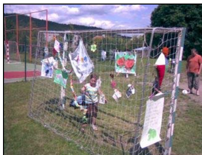
Oslava Dne otců