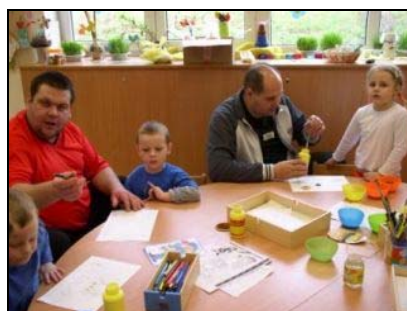
Sobotní Dopoledne pro tatínky