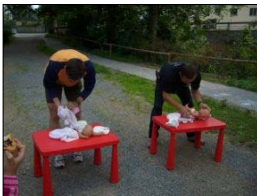
Soutěž v přebalování

Liga otevřených mužů pořádala v neděli 8. června v Integračním centru Zahrada na Žižkově další ročník festivalu Táta fest.